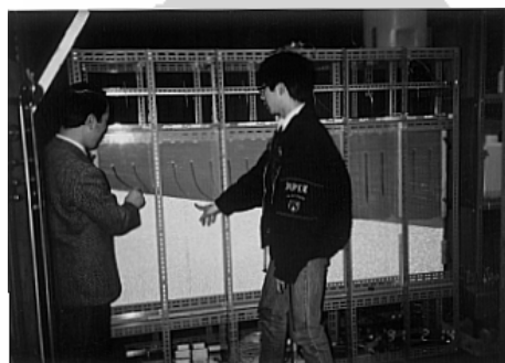
成層土層によるフィンガリング実験