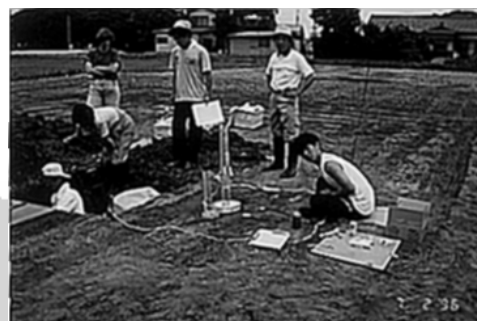
土壤劣化調査、サンプリング (埼玉県深谷市)